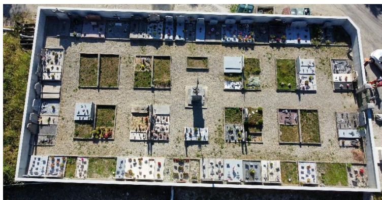
Vue aérienne du cimetière de St Philibert

Retrouvez ces photos aériennes sur le site de la commune à cette adresse : https://saintpierredentremontisere.fr/a-propos-de-nos-cimetieres/