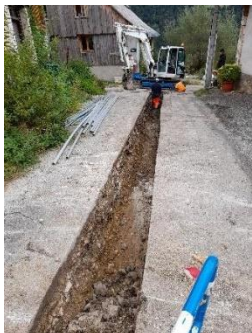
Enfouissement réseaux au Villard