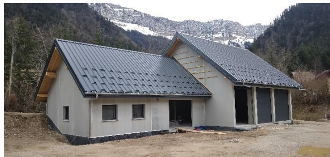
Local technique St Philibert